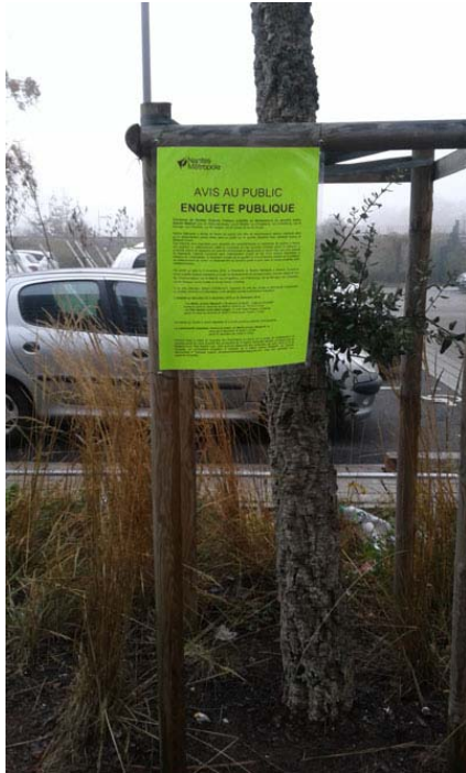
PLANCHE 1 ( suite)- VÉRIFICATION DES AFFICHAGES

Commune de Nantes: enquête publique du 5 décembre 2018 au 20 décembre 2018 sur un projet de déclassement du domaine public de divers espaces de stationnements associés à la voirie communautaire dans le quartier Malakoff (rues de Tchécoslovaquie, de Madrid, d'Angleterre, de Hambourg, de Norvège, d'Autriche, de Hongrie, de Suisse et de Corse)