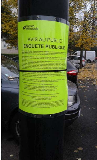
PLANCHE 1 ( suite)- VÉRIFICATION DES AFFICHAGES

Commune de Nantes: enquête publique du 5 décembre 2018 au 20 décembre 2018 sur un projet de déclassement du domaine public de divers espaces de stationnements associés à la voirie communautaire dans le quartier Malakoff (rues de Tchécoslovaquie, de Madrid, d'Angleterre, de Hambourg, de Norvège, d'Autriche, de Hongrie, de Suisse et de Corse)