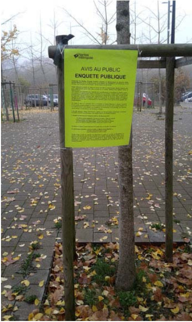
PLANCHE 1 ( suite)- VÉRIFICATION DES AFFICHAGES

Commune de Nantes: enquête publique du 5 décembre 2018 au 20 décembre 2018 sur un projet de déclassement du domaine public de divers espaces de stationnements associés à la voirie communautaire dans le quartier Malakoff (rues de Tchécoslovaquie, de Madrid, d'Angleterre, de Hambourg, de Norvège, d'Autriche, de Hongrie, de Suisse et de Corse)