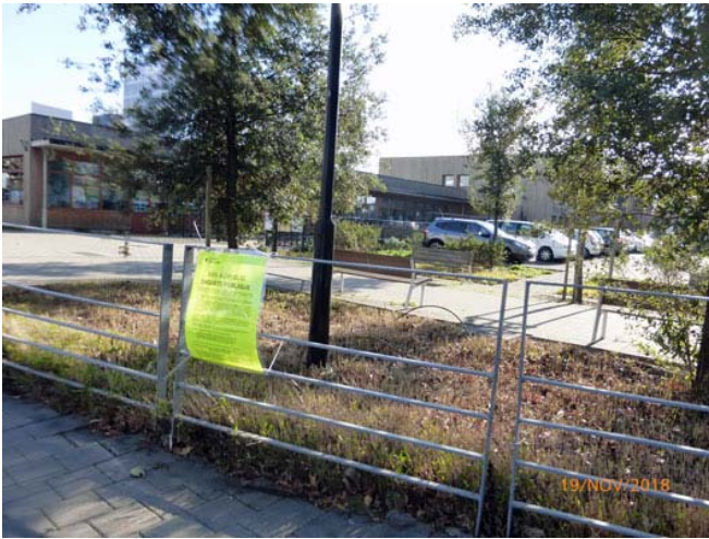
PLANCHE 1 ( suite)- VÉRIFICATION DES AFFICHAGES

Commune de Nantes: enquête publique du 5 décembre 2018 au 20 décembre 2018 sur un projet de déclassement du domaine public de divers espaces de stationnements associés à la voirie communautaire dans le quartier Malakoff (rues de Tchécoslovaquie, de Madrid, d'Angleterre, de Hambourg, de Norvège, d'Autriche, de Hongrie, de Suisse et de Corse)