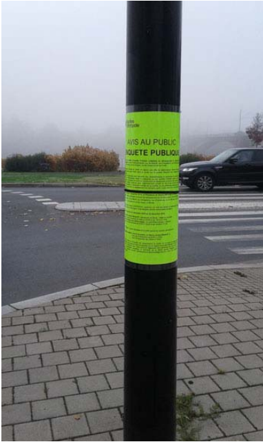
PLANCHE 1 ( suite)- VÉRIFICATION DES AFFICHAGES

Commune de Nantes: enquête publique du 5 décembre 2018 au 20 décembre 2018 sur un projet de déclassement du domaine public de divers espaces de stationnements associés à la voirie communautaire dans le quartier Malakoff (rues de Tchécoslovaquie, de Madrid, d'Angleterre, de Hambourg, de Norvège, d'Autriche, de Hongrie, de Suisse et de Corse)