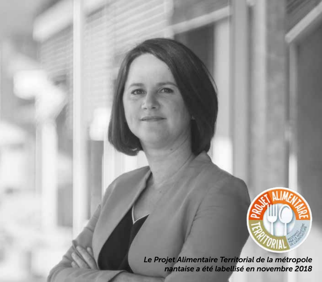
Le Projet Alimentaire Territorial de la métropole nantaise a été labellisé en novembre 2018

« Après un an de travail avec tous les acteurs volontaires, la mise en œuvre des actions du Projet Alimentaire Territorial s'accélère pour construire un nouveau modèle alimentaire local : préservation des surfaces agricoles, accompagnement des producteurs biologique, accroissement de la part du bio et de local dans la restauration collective ou encore proposer des espaces comestibles dans chaque espace vert public et nouveau programme d'aménagement. Le PAT est collectif, local, respectueux de la santé des habitants, de la nature et du climat. »