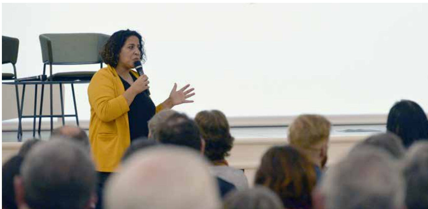
© Rodolphe Delaroque – Nantes Métropole

La conférence de la vie associative du 16 novembre 2019 a consacré une partie de son ordre du jour aux questions d'égalité. Avec l'appui de Gwénaële Calvès, professeure de droit public à l'université de Cergy Pontoise, les responsables associatifs présents ont échangé autour d'une question essentielle : le monde associatif est-il vecteur d'égalité et de diversité pour le territoire nantais ? Les participants ont convenu que l'action associative en elle-même œuvre à l'égalité réelle par l'accès aux droits, aux biens et aux services, par les initiatives ciblées sur la lutte contre les discriminations, par les valeurs dont elles sont porteuses. En fin de rencontre, des associations engagées dans le champ de l'égalité ont présenté leurs actions : Nosig, Espace Simone de Beauvoir, Orpan, Fal, 44, APF, Association Valentin Haüy.