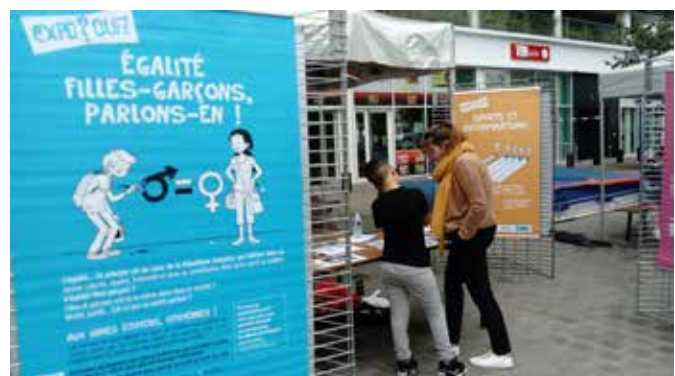
© Mission égalité – Nantes Métropole