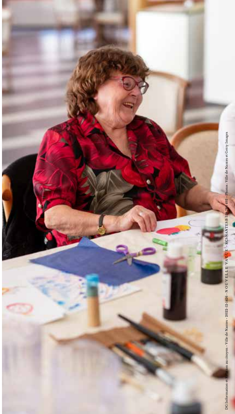
DC Information et Relation au citoyen - Ville de Nantes - 2022-12-14/26 - N O U V E L L E V A C U E - RCS NANTES B 389 756 493

L'étude Activités Physiques et Sportives pour les Âgés (APSAGE) menée avec Nantes Université pour identifier les activités sportives proposées à Nantes aux seniors et comprendre leur motivation à pratiquer ces activités.